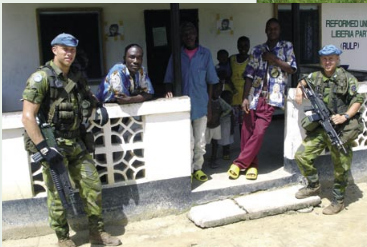
Patrullen besökande ett av partierna.