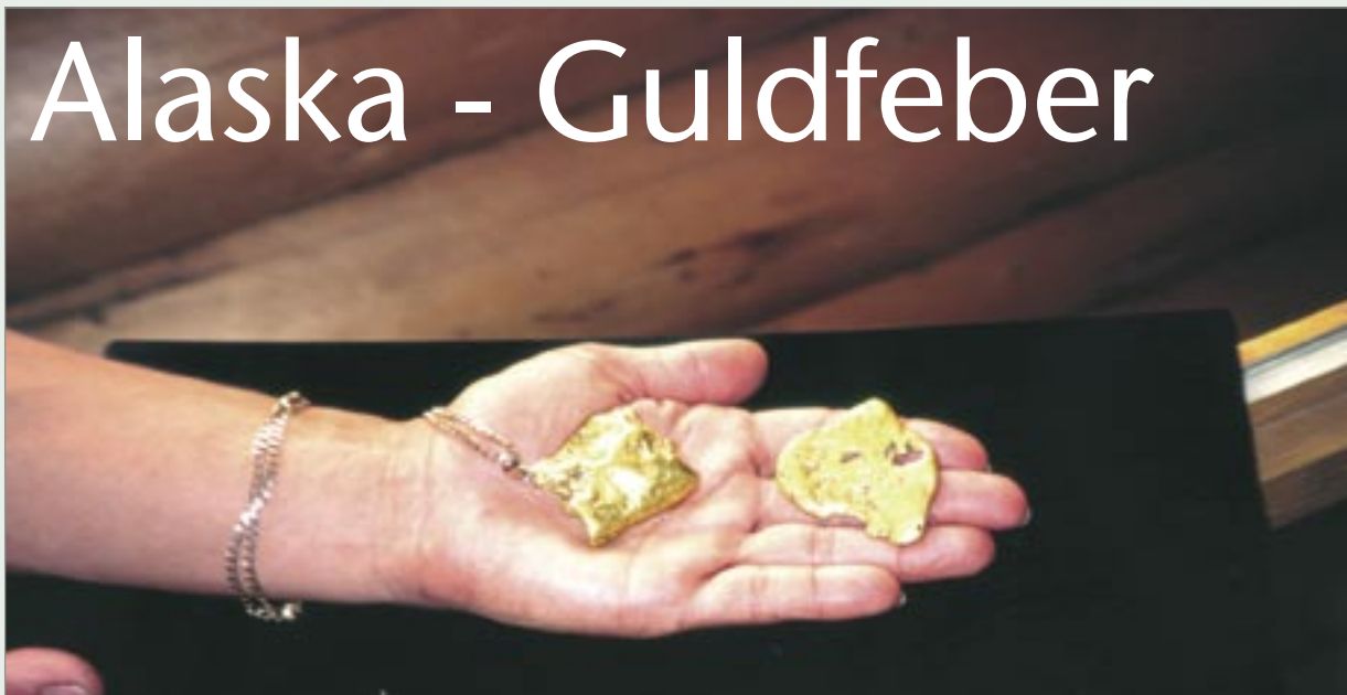
Några äkta guldklimpar.