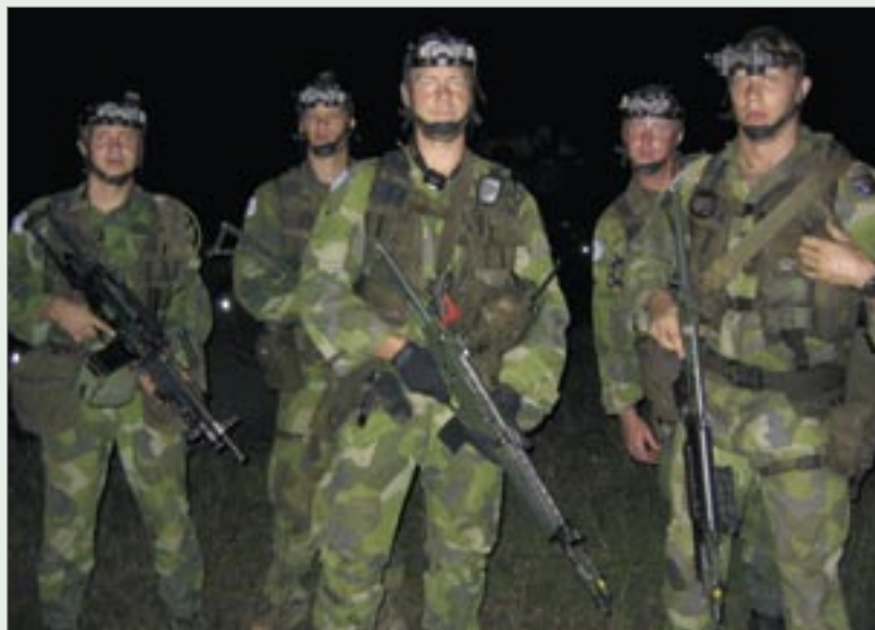
Nattpatrull med Night Vision Goggles på.

norra Liberia. Företaget var mycket omtyckt. Emellanåt stöter man på svenskättlingar som hälsar till oss på svenska. På grund av kriget upphörde all verksamheten och idag hoppas folk på att efter valet ska nya företag bringa nytt liv i gruvdriften.