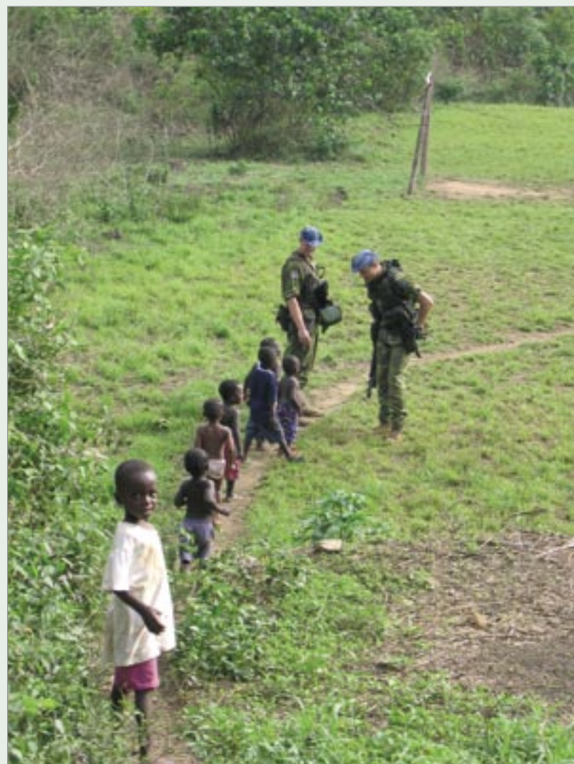
Samverkan med byns barn.

fördes i syfte att lära känna området, prata med invånarna och framförallt visa att QRFen kan ta sig fram varsomhelst om nå-