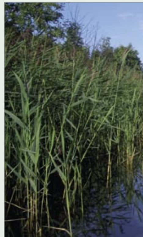
En kontrast till utomskärspaddling!

Den första veckan var vädret bra med svaga sydliga vindar som enligt statistiken är normalt för årstiden. Efter att ha besekrat det så ökända blåshålet Gävlebukten i lugnt vatten så