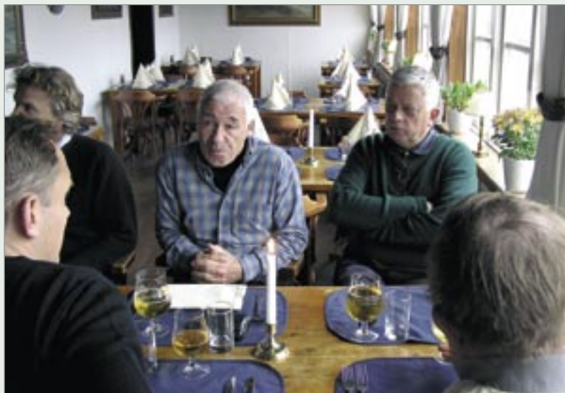
Lunch på värdshuset dagen efter.

nad och förklarade att vi minsann fick stå för lunchen själva. Vad som där före varit, under