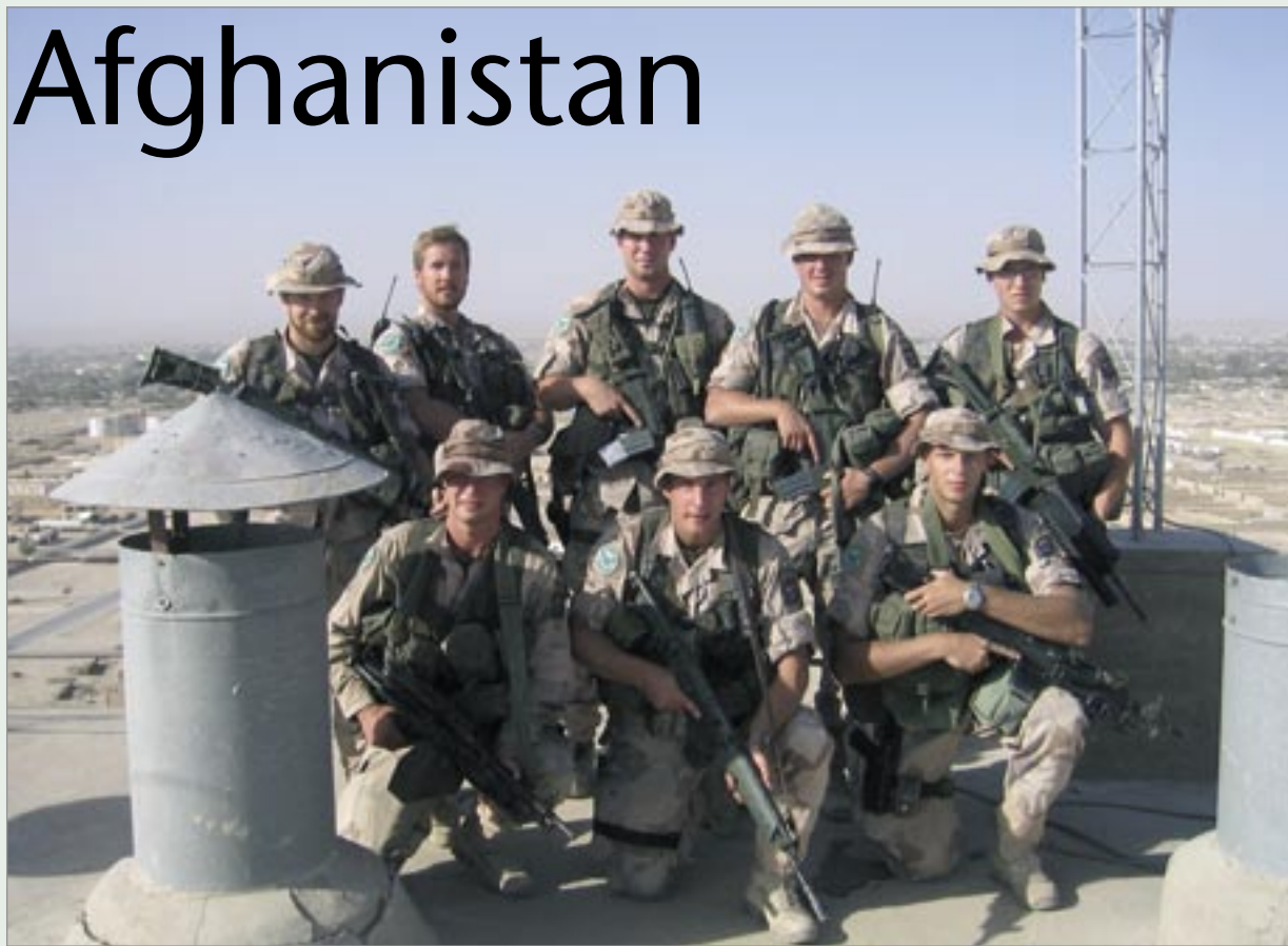
Gruppbild på taket av brödfabriken.