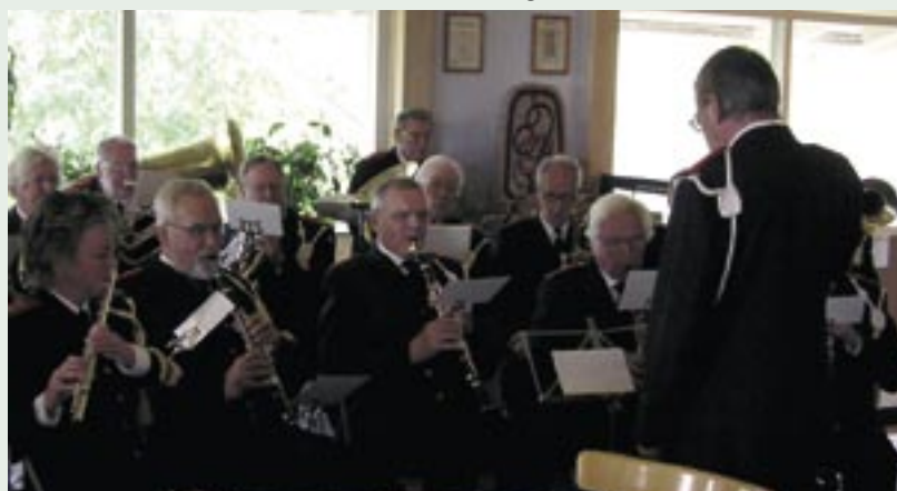
KA 1 frivilliga musikkår underhåller lunchdeltagarna.