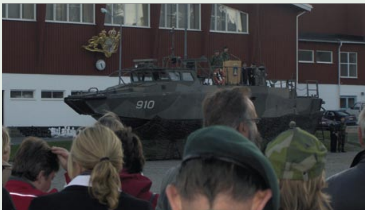
En väl vald talarstol.