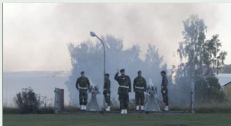
En dubbel svensk lösen - ånyo.