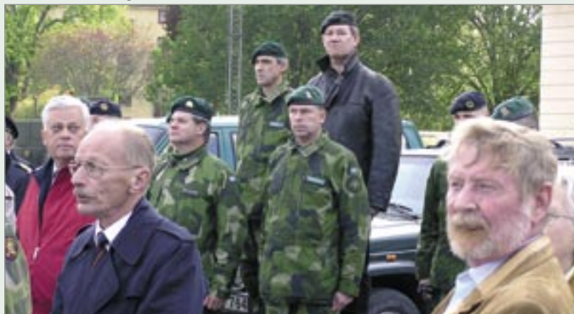
Veteraner i tyst begrundan

Tanken kom för mig att så borde det se ut vid KJV årsmöten. Frånvaron av general Gunnars- uppe dygnet runt, men belyst under dygnets mörka del. Det sköts dubbel svenskt lösen och