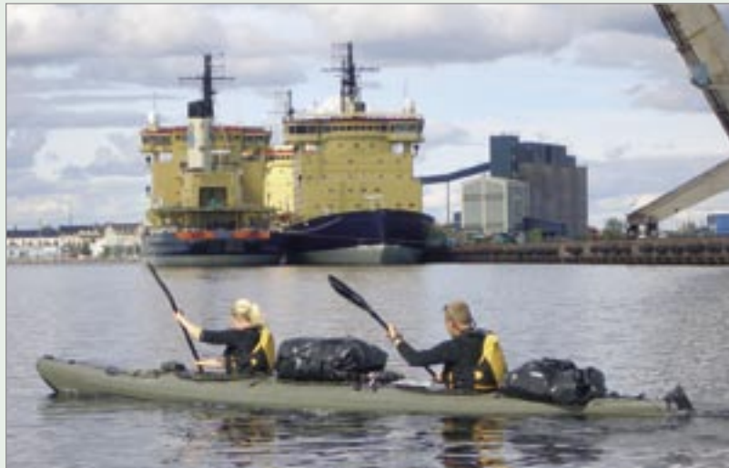
Utanför Luleå stad med drygt två timmar kvar.

Efter 14 dagar når vi Härnösand och början på världsarvet Höga Kusten, tre dagar senare än beräknat. Dessvärre parkerar ett monsterlågtryck över oss och dagarna på inblåsningkontot ökar. På den 19:e dagen släpper lågtrycket för bättre väder och vinden vrider till väst. Vi avverkar den största delen av den imponerande Höga Kusten med sina svindlande höjder och djup på blott en dag. Synd att behöva stressa igenom något så vackert, vi får lov att återvända. Vid Skagsudde som kännetecknar