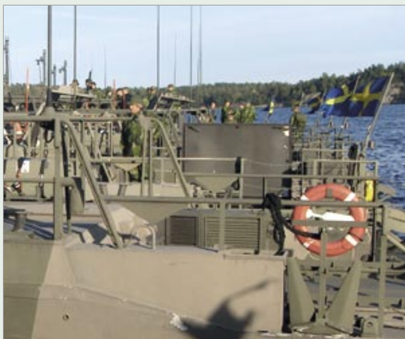
Uppsamlingsplats inför avfärd till Berga.

Sammanfattningsvis kan det konstateras att ceremonin och övertagandet på Berga var lika högtidlig och högstämnd som avskedsceremonin på Rindö varit,