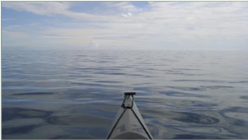
Helt magiskt vatten söder Hornslandet.