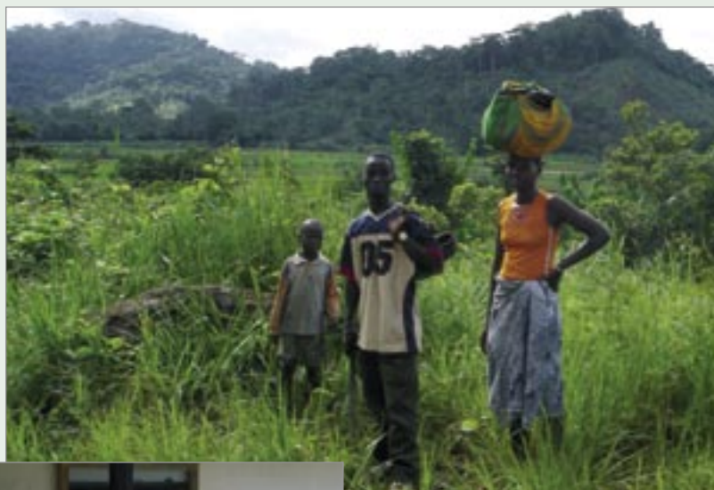
Nedan: Fin vy över norra Liberia.