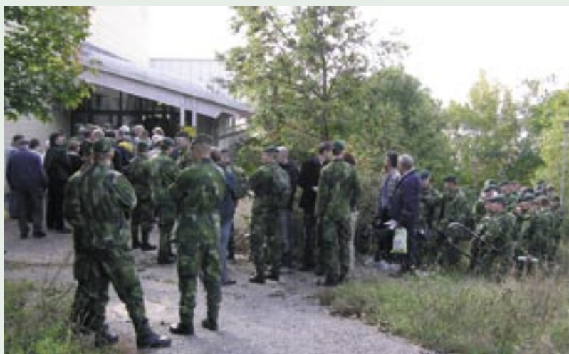
Lång kö till den inledande lunchen

Dagen startade med en omfångsrik lunch. En lång kö ringlade sig utanför tjänstemannamatsalen före öppnandet. Eftersom kökspersonalen varit förutseende blev det inga långa väntetider, för utskänkningsgjordes på flera tåter. Så följde ceremonin på kaserngården utanför kanslihuset. Jag kan meddela läsaren att den sitter