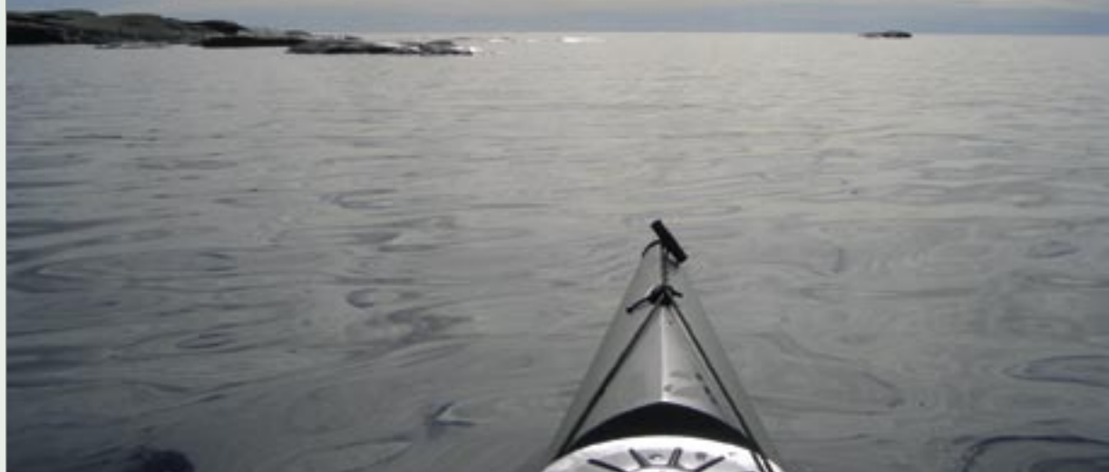
Stillsam paddling i arla morgonstund, Skagsudde.