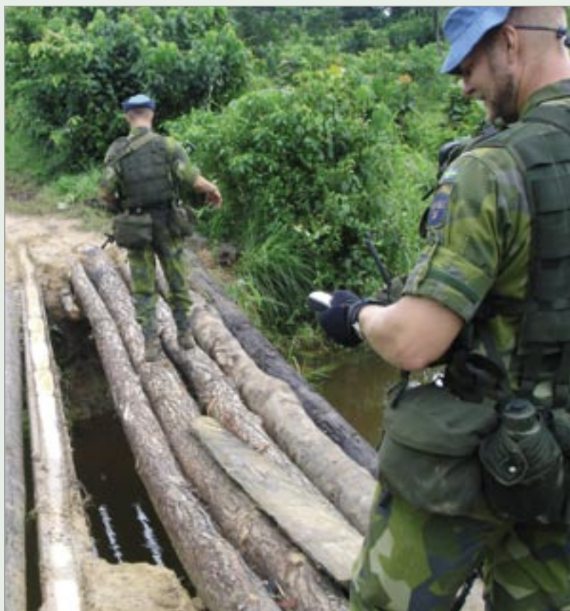
Ovan: Ganta Sanniqelle - en av många broar.

För 20-25 år sedan var Liberia ett föregångsland i Afrika, med fungerande el, avlopp, hotell, vägar osv, ett land dit många gärna åkte på semester. När man idag kommer hit och ser vad kriget gjort med detta samhället är det väldigt svårt att föreställa sig hur det en gång sett ut.