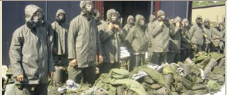
Skyddsövning med full mundering.

Som ni har läst i tidningen och på våra hemsidor så håller vi på att få igång projekt insatsstyrka (IS) och det kommer att innebära en hel del förändring i kursutbudet för nästkommande år. Det gäl-