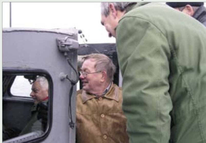
Säker hemfärd med "Classe" som rorgångare och "Wicke" som övervakare.