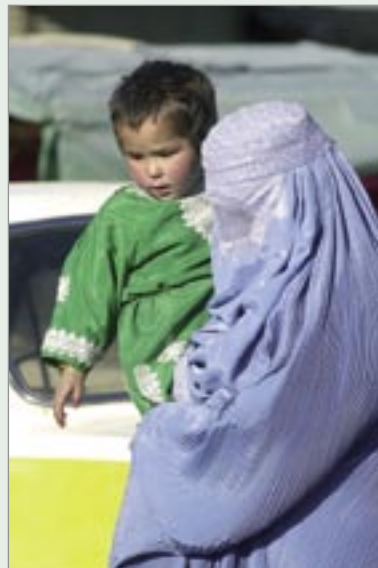
Kvinna med buhrka.