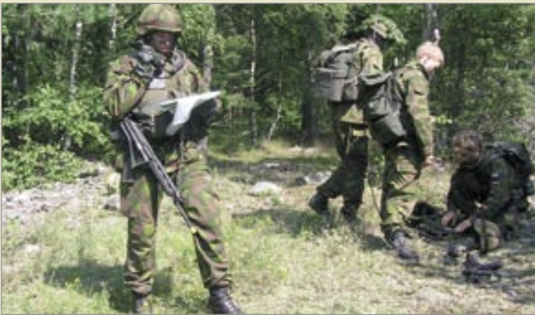
Avrapportering - under samövning med Finland.

Förbundet Kustjägarnas andra utbildningsår lider mot sitt slut och vilket år det har varit. Resultat kan mätas på olika sätt och ett sätt är att presentera det i siffror, sagt och gjort - vi börjar där. Av 35 planerade kurser så har 30 genomförts, 8 icke initialt planerade kurser har lagts in som nya kurser och dessutom har 3 kurser arrangerats och genomförts åt andra frivilligorganisationer. Totalt har 319 personer deltagit och tillsammans utbildats 2069 utbildningsdagar. Observera att i frivilligvärlden är en utbildningsdag 6 timmar och således blir 2069 utbildningsdagar 12 414 utbildningstimmar. Alltihopa är en markant ökning i förhållande till vårt första utbildningsår och än mer anmärkningsvärt är att vi har genomfört all utbildning till lägre kostnad i förhållande till föregående år. Vi tilldelades mindre pengar för utbildningsåret 2005 än vad vi hade för 2004 men har ändå lyckats få ut mer utbildningsomfång för det vi tilldelades. Detta tack vara bättre samarbete med till exempel Södertörngruppen och andra organisationer.