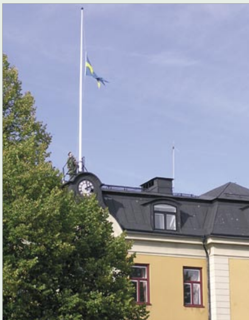
Den tretungade fanan halas från kanslihuset.