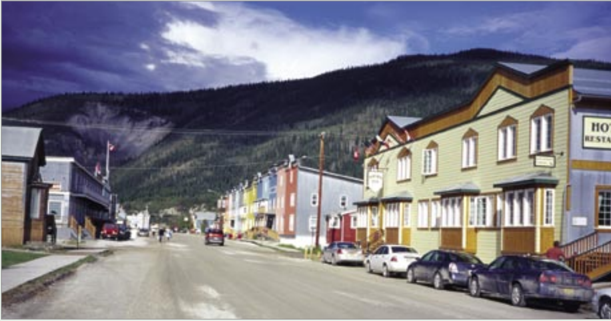
Dawson City, som det ser ut idag. En småstad nedanför bergen.