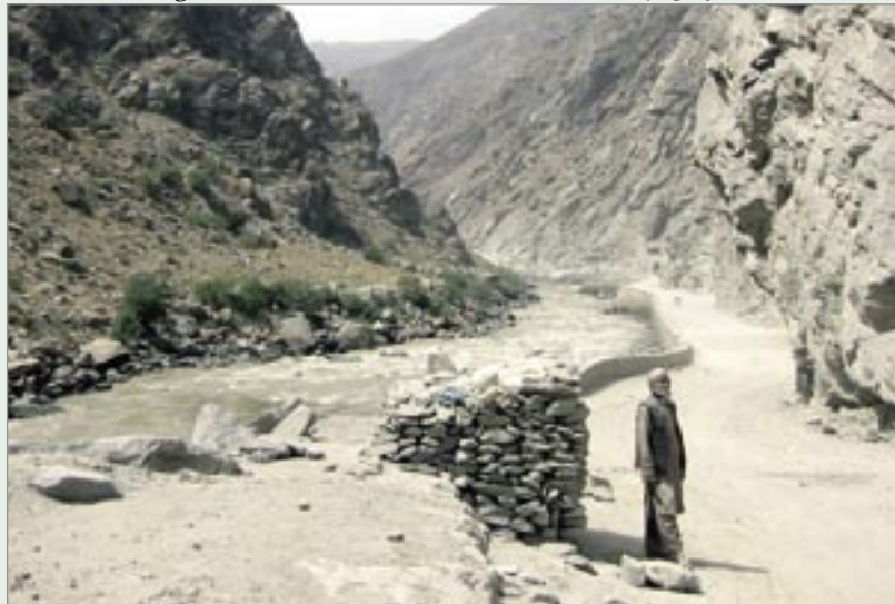
Vägen till Jalalabad.

Första dagarna möttes vi av en otrolig värme med temperaturer runt 50 grader på dagarna och med den svenska sommaruniformen m 90 svettades vi floder. Vi blev senare dom första svenskarna i modell 90 öken. En försöksuniform med mycket tunnare tyg. Landet är mycket vackert med höga bergsmotiv som går ut i sandstappöken. Här bor vad jag tycker världens